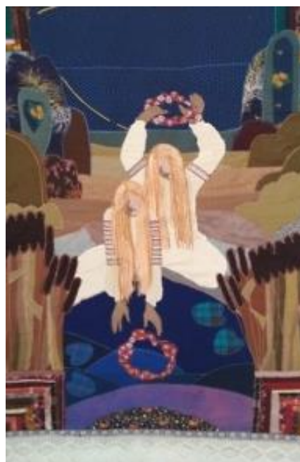
Рис. 2. Е. Лось. «Купалье»

Отечественный искусствовед М. Кацер приводит пример воплощения образа купальского венка на постилке мастерицы прошлого века М. Похлевой (Городокский р-н Витебской обл.) (рис. 1). В центре композиции располагается восьмиконечная розетка, окруженная цветочной гирляндой; под ней – вазон с цветами, образ которого расшифровывается как пожелание женского счастья. Образ венка в данном произведении состоит из четырех стилизованных крестов, каждый из которых включает в себе похожие фигуры меньшего размера. М. Кацер отмечает, что крест использовался для защиты от всяких напастей человека, на голове которого находился венок [3, с. 94]. Такое очевидное слияние креста и купальского венка в одной работе является выражением двоеверия, возникшего в результате симбиоза двух враждебных друг другу религий. Данное произведение примечательно тем, что в нем присутствует образ венка, связанного с языческим праздником