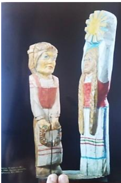
Рис 11. В. Поливко «Купалье»

На вытинанке Т. Курцевич «Проводы русалки» (2009, белая бумага, цветная бумага) изображена сцена одноименного обряда, который автор связывает с праздником летнего солнцестояния (рис. 12). Образ венка, один из которых расположен на голове девушки, а другой – в ее руках, представлен здесь с помощью трех нежных цветов голубого цвета. Подобные цветы также изображены на длинных волосах обеих девушек, в руке младшей, и расположены полукругом вокруг их фигур. Это создает атмосферу таинственности совершаемого обряда. По словам автора, данный обряд совершался в купальскую ночь, когда для девушки с самыми длинными волосами, а также для выбранной для нее «дочери» плели венки и отправляли их совершать дальнейшие праздничные обряды [из личного интервью с автором]. Таким образом, автор в своем произведении изображает венок как знак причастности девушек к «нечистой силе» – русалкам.