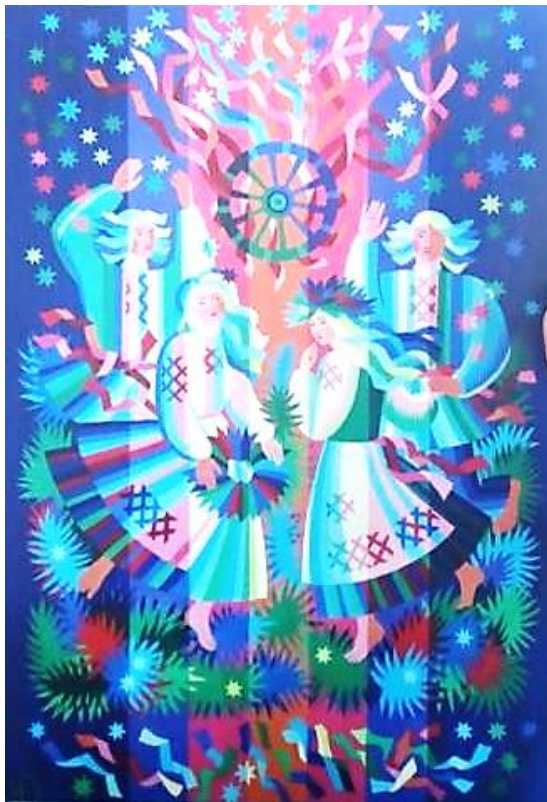
Рис. 5. Н. Суховерхова. «Купалье»

человеческих фигурах, напоминают о воссоединении с природой. В данном произведении образ венка является ключевым, поскольку именно он позволяет правильно постичь замысел автора: любовь во время праздника летнего солнцестояния в гармонии с окружающим миром.