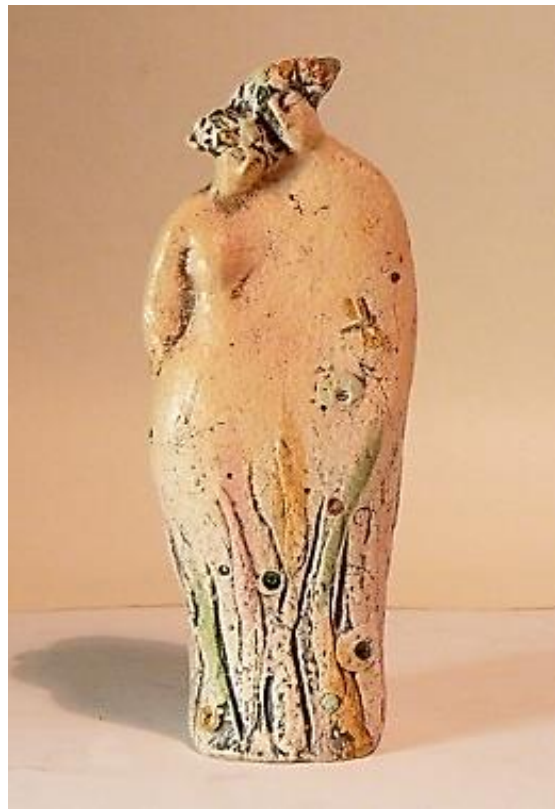
Рис. 6. О. Ткачев. «Купалье»

На триптихе Л. и В. Ковальчук «Купалье» (2008. Терракота, ангобы, глазури) образ венка представлен в виде головного убора (рис. 7). Его очертания угадываются атмосфере легкого марева жаркого дня. В первой части произведения он легким коричневым облаком покоится на слегка склоненной голове девушки, стоящей в густой траве и окруженной бабочками и стрекозами. Вторая часть представляет двух длинношеих красавиц, чьи волосы украшены пышными уборами в виде венков голубого оттенка, сливающимися с синим фоном дальнего плана. Вкрапления коричневого и желтого цветов позволяют нам предположить, что художники показывают образ купальских венков. В третьей части произведения венки покоятся на длинных волосах полуобнаженных девушек, стоящих в траве и грустно глядящих вверх. Сочетания голубого и коричневого оттенков создают атмосферу умиротворения. Здесь Купалье – не столько праздник летнего солнцестояния с его поправлением моральности, а некое интимное таинство, в котором главную роль играет женщина. Можно предположить, что авторы изобразили здесь не людей, а русалок, которые были достаточно активны в период празднования дня летнего солнцестояния.