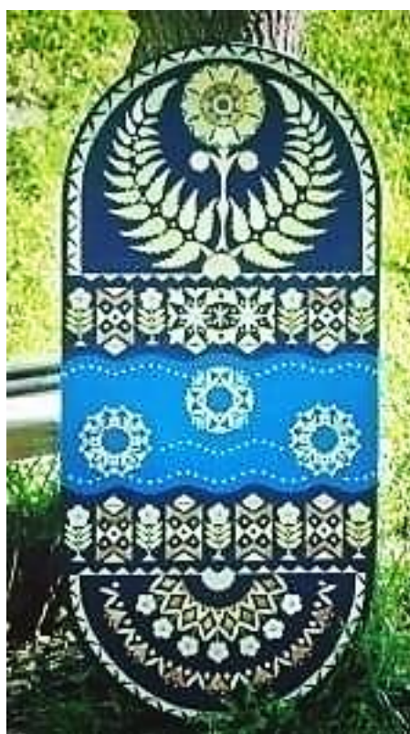
Рис. 13. Д. Коваленко «Белорусский календарь. Купалье»

По реке небесно-голубого цвета «плывут» три круглых предмета. Два из них расположены симметрично, идентичны по форме, в них присутствуют растительные и цветочные мотивы. Третий венок, находящийся чуть выше остальных, имеет более выраженные геометрические детали. Контраст голубого фона и натуральных оттенков соломки, множество мелких деталей наделяют образ венка легкостью и изяществом. Волнистые линии из ряда точек добавляют динамичности, производя эффект движения венков по водам реки. Здесь автор предлагает зрителю с помощью данного образа прикоснуться к обряду гадания, происходившему во время праздника летнего солнцестояния.