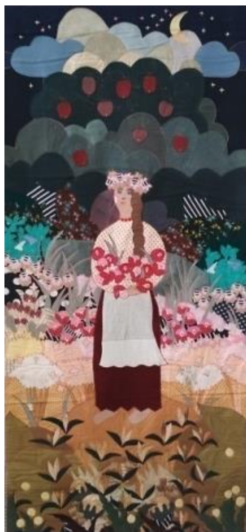
Рис. 4. Е. Лось. «Купалинка»