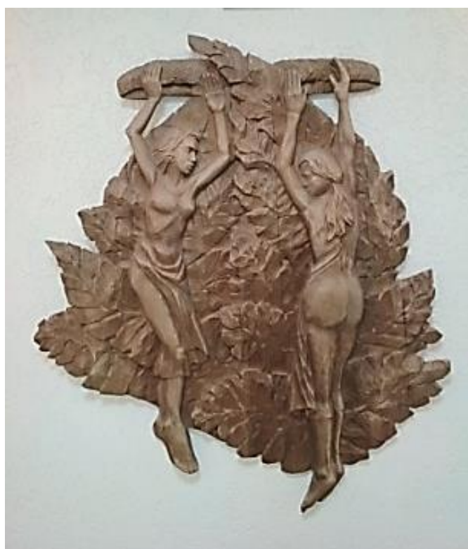
Рис. 8. А. Гомолко, В. Лашук. «Купальские венки»