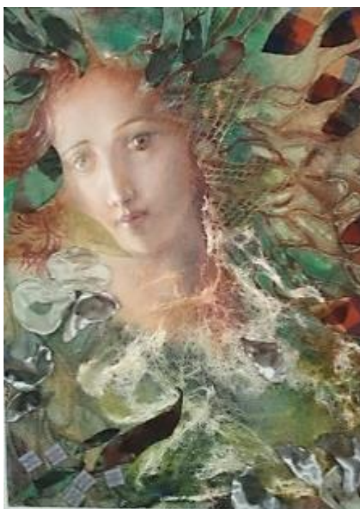
Рис. 3. Е. Лось. «Купалье»

Произведение Е. Лось «Купалье» (бел. «Купалле», 1983. Аппликация, хлопок, лен. 120x90) раскрывает сюжет купальского гадания (рис. 2). Две девушки пускают по реке свои венки с целью узнать будущее. Следует обратить внимание на то, как художник изображает лица участниц обряда: у них отсутствуют глаза, закрытые длинными светлыми волосами. Все внимание сосредоточено на темных кистях рук, оттеняющих нежный цвет венков. Контраст является одним из главных выразительных средств данного произведения. Это служит для привлечения внимания к процессу гадания: белые рубашки девушек буквально светятся изнутри. При изображении венков, Е. Лось использует оттенки розового: от наиболее бледного до крайне насыщенного. На синем фоне реки дальнего плана образ венка приобретает объемность, а цвет лиц, вышивка на рубашках и пастельные тона стилизованных растений, с помощью которых автор создает ландшафт за спинами гадающих, уравновешивают созданный контраст, придавая образу венка нежность и таинственное очарование.